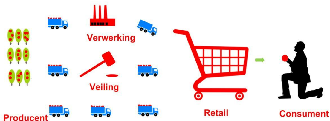
Figuur 1. De voedselketen van appels en peren